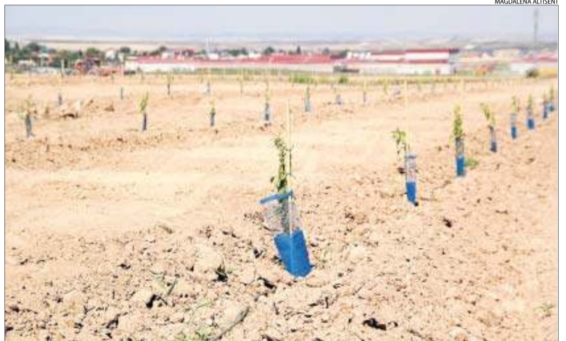
Imatge de la plantació, que s'ha dut a terme el mes de maig.

La posada en regadiu, els arbres i la plantació han requerit una inversió propera als 70.000 euros