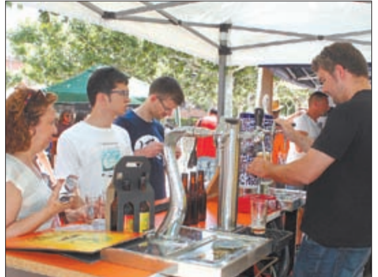
Els visitants van poder gaudir de 78 varietats

Els organitzadors de la Fira de la Cervesa Artesana de Tàrrrega, l'Associació Agrat i Matoll, van valorar ahir molt positivament la tercera edició que es va celebrar dissabte i que la consolida com una de les fires amb més públic del territori català. Durant les 12 hores que va durar el certamen es van servir 2.200 litres