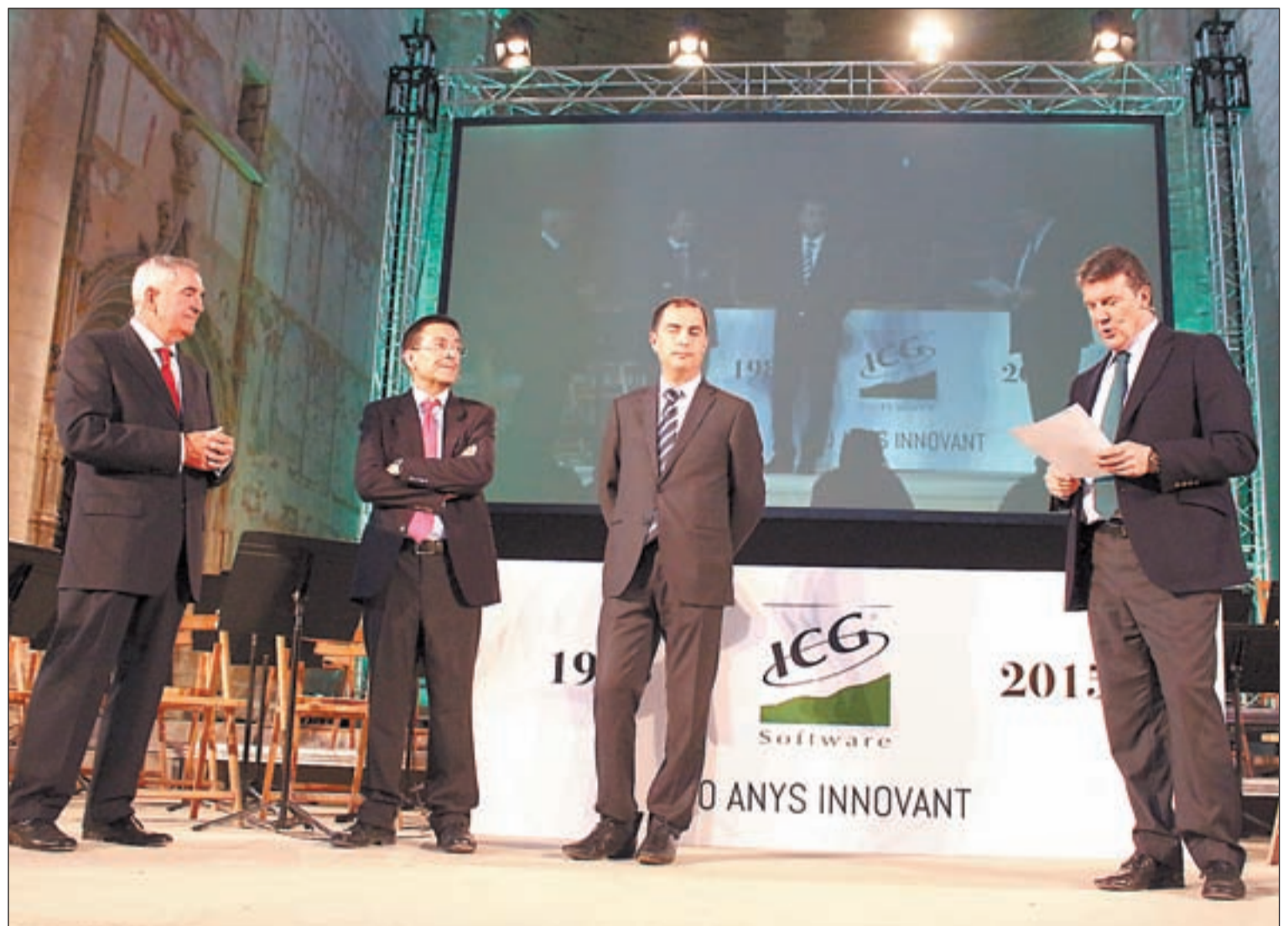
Unes 400 persones van celebrar ahir amb ICG el seu 30 aniversari. La companyia ha estat pionera en el software gràfic tàctil

ICG va néixer a la ciutat de Lleida ara fa tres dècades, l'any 1985,