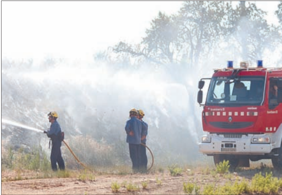
El foc es va iniciar a una zona no conreada entre els municipis de Lleida i Torrefarrera