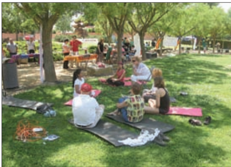
Unes 150 persones van participar al certamen

Fuliola. Al matí van tenir lloc les actuacions de la Colla Gegantera i grallera El Gabatxet, una exhibició de country a càrrec de l'agrupació Big Ben Country, un col·loqui sobre el llibre Jo ho veig així... de moment , de Jordi Besora, així com exposicions i activitats de totes les entitats del municipi. Les activitats eren gratuïtes i obertes a la participació de tothom.