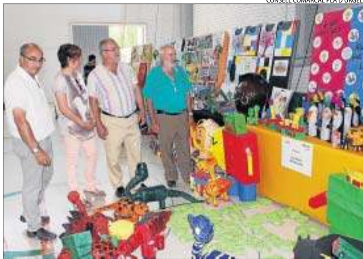
CONSELL COMARCAL PLA D'URGELL