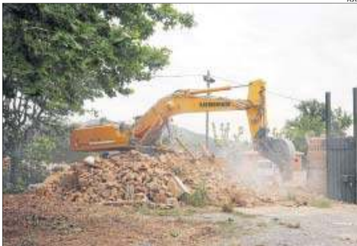
La demolició d'edificis en ruïna de Mitasa d'Alfarràs.