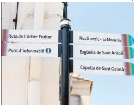
Un pal de senyals a diversos punts del patrimoni d'Aitona.

AITONA | L'ajuntament d'Aitona està finalitzant els treballs de senyalització de totes les rutes que condueixen a monuments del seu patrimoni arquitectònic i natural, com és el cas dels camins que porten als camps de fruiters per veure in situ el moment de la floració. Aquesta actuació ha suposat una inversió d'uns 3.000 euros i s'engloba en la promoció de l'ecoturisme.