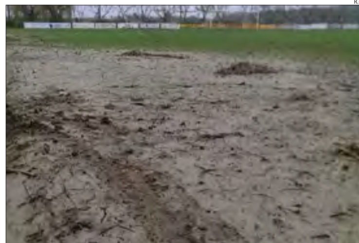
Aquest és l'estat en el qual ha quedat el camp de l'Anglesola.