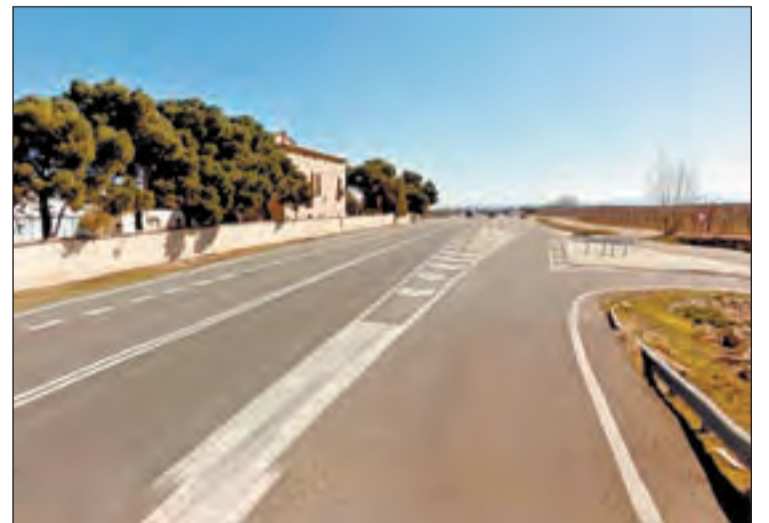
FOTO: / Imatge de l'actual intersecció al terme municipal de Torregrossa

El projecte contempla la substitució de la intersecció existent a Margalef, al terme municipal de Torregrossa, que té forma de glorieta partida i en la que el trànsit que circula per la carretera N-240 té prioritat, per una glorieta completa que reduirà la velocitat de pas dels vehicles. Concretament es preveu transformar la intersecció actual en una rotonda sencera i tancada, que tindrà un radi interior de 15 metres amb dos carrils, vorals de 0,5 metres i voreres