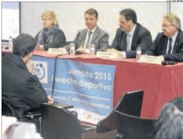
Tibau ahir en la inauguració de la jornada de dret esportiu.

El responsable català d'esports va inaugurar ahir la III Jornada de dret esportiu i, a continuació, va visitar instal·lacions esportives a les poblacions de Seròs i Torrefarrera.