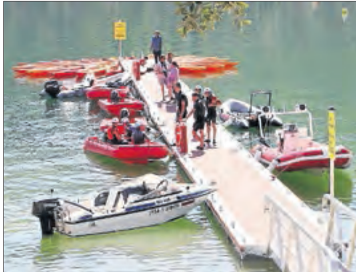
L'embarcador de Pomanyons que va entrar en servei el 2014.

El consorci Segre-Rialb va adjudicar la redacció del pla urbanístic l'estiu passat i ara el dona a conèixer als veïns dels sis pobles que integren el consorci Baronia de Rialb, Ponts, Tiurana, Bassella, Oliana i Peramola, així com a les empre-