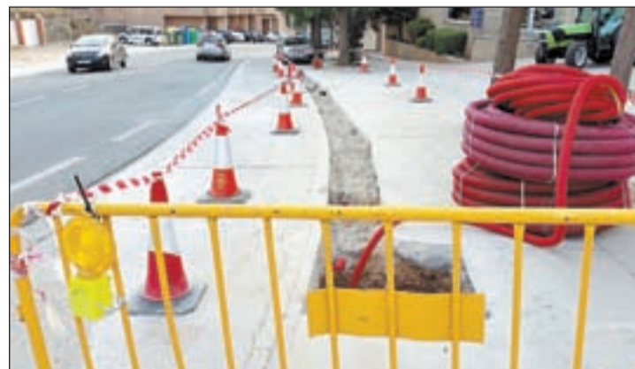
Imatge de les obres que s'estan realitzant

L'objectiu és ara avaluar els recursos i els ajuts disponibles que Tàrrrega pot posar a l'abast en relació a la resposta solidària de Catalunya davant la crisi migratòria actual.