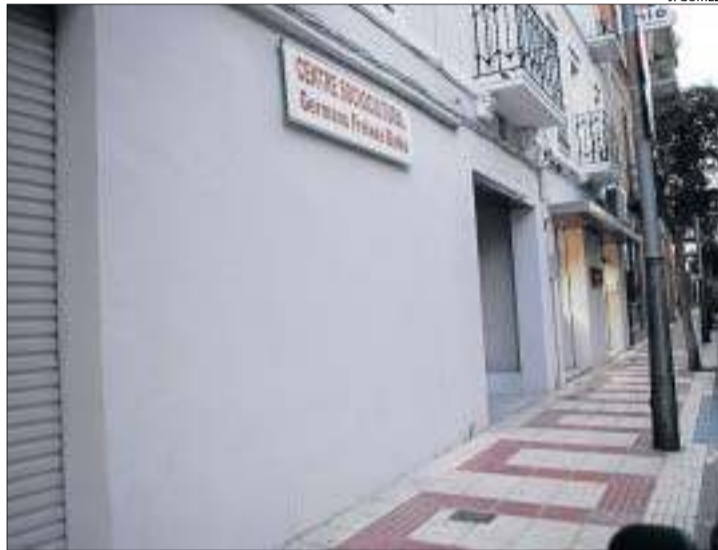
L'actual façana de l'antic Musicland.

L'antic Musicland va passar a mans municipals a l'any 2010 després del tancament com a