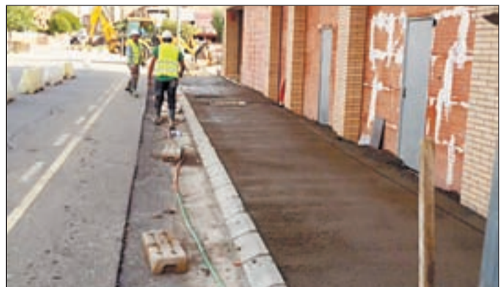
Zona on s'ha fet l'actuació

menys de 25 anys. D'altra banda, a les comarques de Lleida, es van registrar 14.842 contractes al setembre, 3.171 menys que el mes anterior, el que representa un 17,6% menys. Respecte el setem-