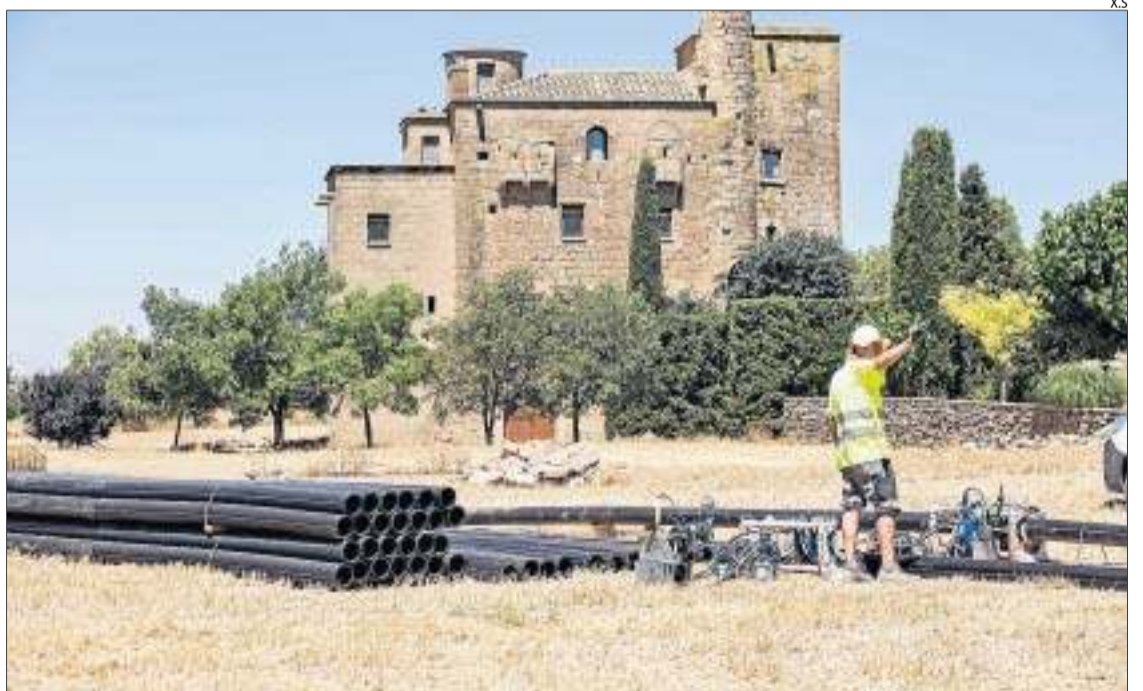
Imatge d'arxiu de l'inici de les obres de la conducció d'aigua que portarà aigua fins als Plans de Sió.

El consell, no obstant, sí que assumirà els 185.000 euros que suposa acabar la canalització que ha de portar aigua des de la potabilitzadora de Ratera fins als Plans de Sió (també prove-