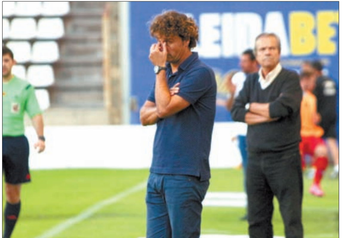
El técnico no buscó excusas a la goleada encajada

Sobre el partido, Idiakez reconocía que “no hemos sabido jugar. Ellos en el minuto 60 han decidido jugar con cuatro puntas, nosotros hemos tenido situaciones de tener el balón y dar pases, pero hemos querido terminar muy rápido varias opciones que han permitido al Villarreal correr. Todo se ha precipitado y hemos perdido el control del partido. Lo que nos ha pasado no tiene que ver con la actitud, si acaso con la falta de inteligencia para jugar”.