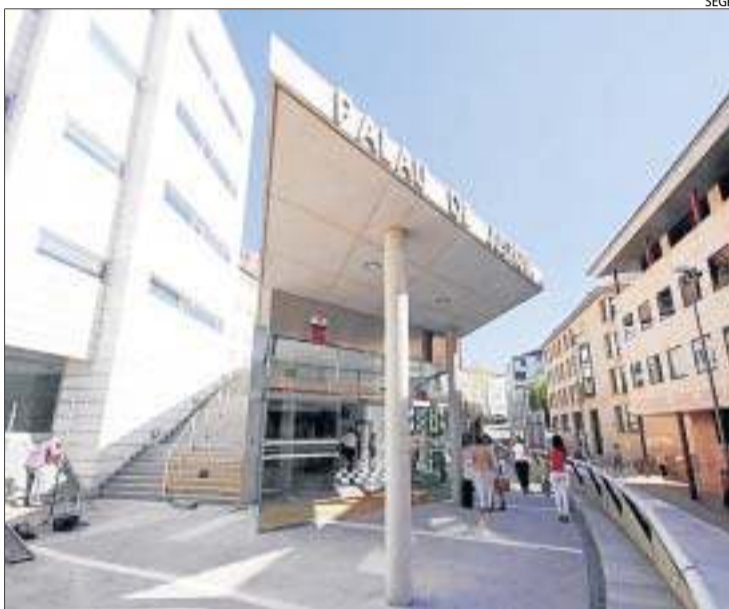
Els fets seran jutjats a l'edifici del Canyeret.

Finalment, la firma va ser venuda a dos estrangers que són en parador desconegut. Després d'aquest període, la firma va tornar a mans dels propietaris originals, segons afirma la Fiscalia, en execució del pla preconcebut entre tots i simulant l'incompliment del contracte de lloguer pactat.