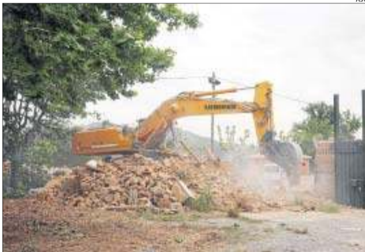
La demolició d'edificis en ruïna de Mitasa d'Alfarràs.