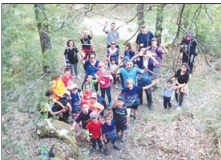
Les activitats volen promoure l'excursionisme entre els nens

El Club Excursionista de Vilaller és un dels més actius del Pirineu i organitza importants esdeveniments esportius a les muntanyes de l'entorn ribagorçà, alguns en solitari i altres amb la col·laboració d'altres clubs, entitats i la Fe-