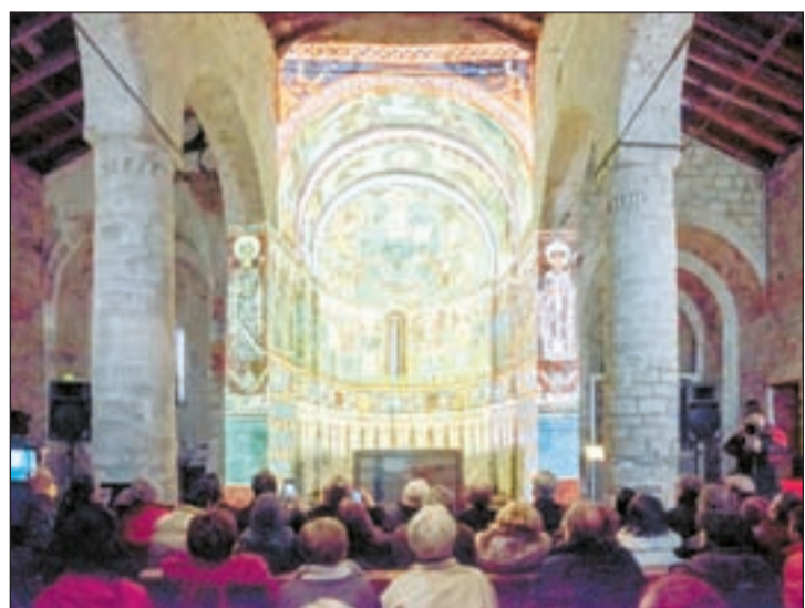
Mostraran el video-màpping de Sant Climent

Vilaller s'incorpora al moviment Viles Florides, que ja suma 75 municipis a tota Catalunya així com més de 200 llars i espais públics al llarg de tot el territori. Viles Florides és una iniciativa de la Confederació d'Horticultura Ornamental de Catalunya (CHOC) que promou la transformació de racons, pobles i ciutats de Catalunya a través de la flor i la planta ornamental. El projecte busca posar en valor la protecció dels espais verds i la millora de la qualitat de vida.