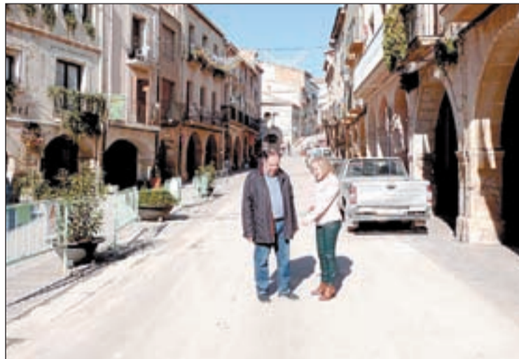
Els regidors d'Urbanisme i de Governació, a la plaça

Aquesta plaça és un dels punts més emblemàtics i turístics de la capital de les Garrigues i és molt transitada, tant per vehicles com per persones. A causa del seu pas continu el paviment es va anar deteriorant fins a dificultar el trànsit per aquesta via. Per aquest motiu, s'ha dut a terme una actuació de substitució de la peça d'acabat del paviment continu. Aquesta actuació s'espera