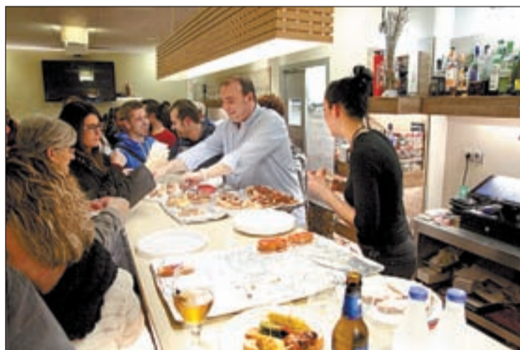
Veïns de Torrefarrera degustant els pinxos

El bar restaurant Bodegueta de Torrefarrera va oferir ahir a la nit pinxos solidaris a 1,50 euros i tires de números per entrar en el sorteig diversos premis a 2 euros en benefici d'Afanoc, l'associació de Nens amb Càncer. D'altra banda, Alcarràs també ha recaptat 497 euros per aquesta associació durant el berenar de dissabte.