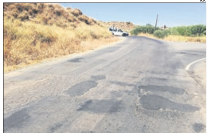
Llum verda al camí d'Alpicat de Torrefarrera ■ L'ajuntament d'Alpicat ha donat llum verda al projecte de millora del ferm del camí de Torrefarrera, que costarà 194.000 €.

Latorre va indicar que el consistori parlarà amb els responsables dels Mossos d'Esquadra perquè intensifiquin la vigilància a la zona, encara que va puntualitzar que serà molt difícil agafar els presumptes lladres.