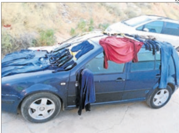
Algunes de les actuacions que s'han recriminat.

AITONA | Des del mes de maig passat, Aitona compta amb la figura de l'agent cívic per vetllar per la bona convivència i el compliment de les normes cíviques del consistori. Durant aquests primers mesos, els agents han portat a terme una mitjana de dos intervencions al dia per evitar comportaments incívics que alterin la vida veïnal.