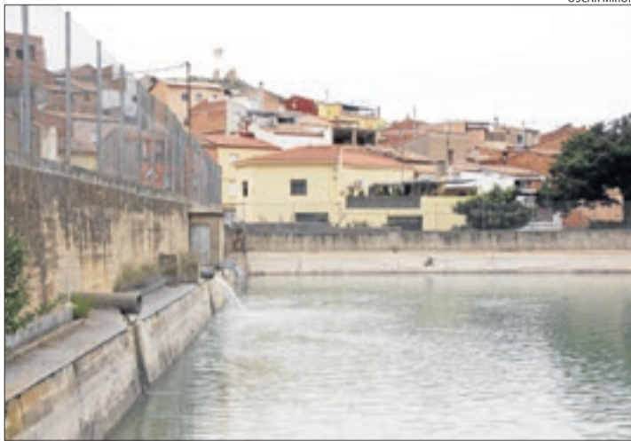
La bassa que emmagatzema l'aigua i quedarà en desús el 2017.