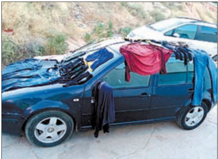
Una de les mostres d'incivisme a Aitona