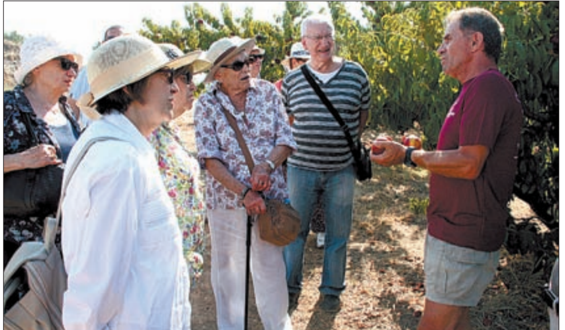
Un pagès del municipi d'Aitona explica als turistes com es produeix la fruita

L'execució del projecte es preveu que es prolongui durant dos mesos, de manera que, si es compleixen tots els terminis previstos, les obres podrien estar llestes abans de final d'any o inicis de 2017. L'execució de l'obra contempla la millora i reparació del tram que correspon a Alpicat en tota la seva longitud i que té deteriorat l'estat del ferm.