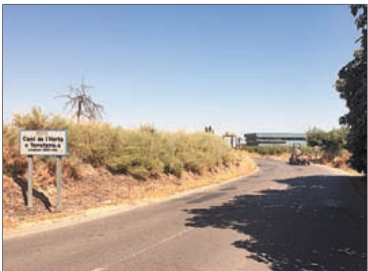
Imatge de l'estat actual del ferm del camí

finalitat dels agents cívics és la de fomentar la cultura cívica tot realitzant avisos i cridant l'atenció a aquelles persones que no respectin el mobiliari urbà i l'espai públic, malmetin la imatge del poble amb el seu comportament, pertorbin la calma durant la nit, etc. En la seva tasca diària, l'equip d'agents cívics ha detectat diverses mostres d'incivisme durant les darreres setmanes.