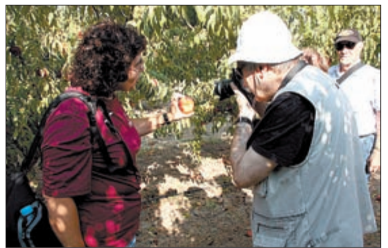
Un dels participants fotografiant una platerina

La visita finalitza amb un dinar a un restaurant de la població. Ahir van protagonitzar la visita,