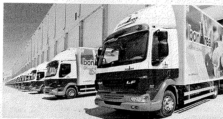
Durant el 2013 la CAG ha fet inversions de 33 milions d'euros ■ EMI

Pel que fa als pinsos, l'altra activitat destacada de la CAG, la producció anual a les deu fàbriques se situa en els 1,15 milions de tones de pinso, igual que en l'exercici anterior. La facturació ha pujat fins a 351 milions