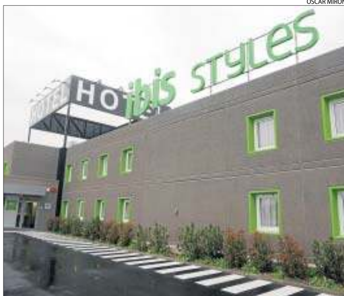
El nou hotel de la cadena Ibis a Torrefarrera.

El nou hotel de Torrefarrera, que funciona en règim de franquícia, disposa de 46 habitacions, connexió Wi-Fi gratuïta i accés directe des de l'autovia A-2.