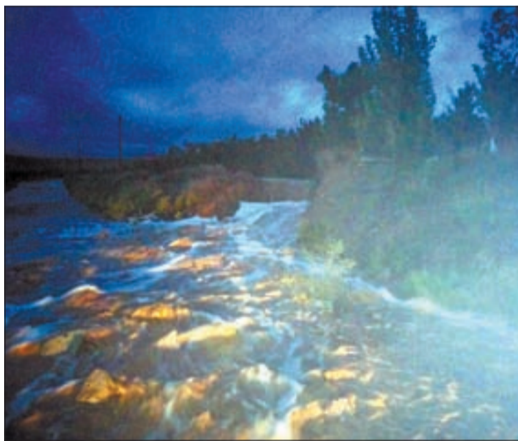
UNIÓ DE PAGESOS