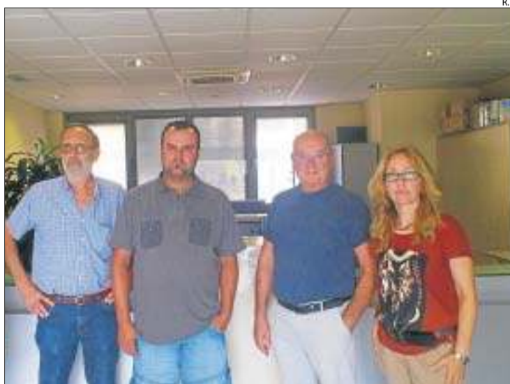
Representants de la Generalitat, Unió de Pagesos i afectats, ahir.