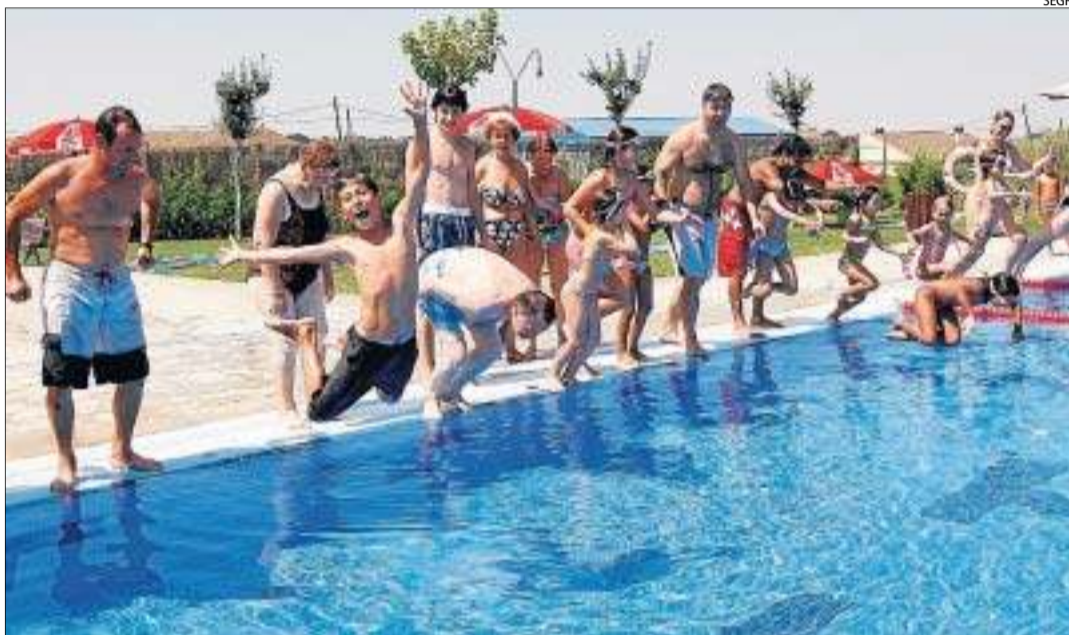
Vista d'arxiu de les piscines municipals dels Alamús.

El consistori obrirà les piscines aquest dissabte, una vegada finalitzades les actuacions