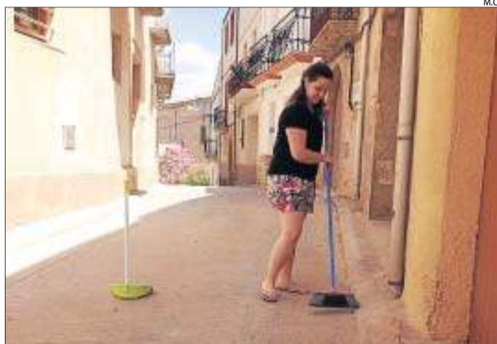
Una veïna de Bovera, escombrant un tram del seu carrer.

"Tot el que siguin obres menors les executem l'agutzil i jo per amor a l'art i intentem donar el millor servei. Última-