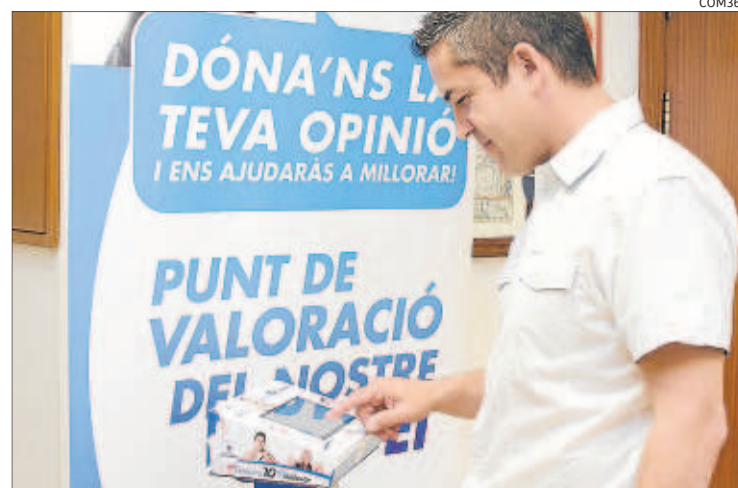
Un veí contesta les preguntes a través del terminal que hi ha al consistori