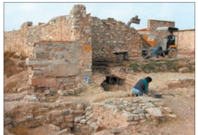
AJUNTAMENT DE TÀRREGA