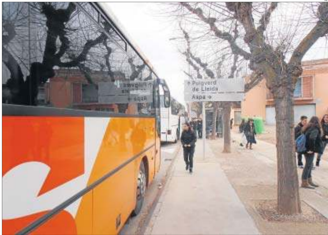
Transbord del bus de la línia de l'Albagés (blanc) al que cobreix el recorregut entre Artesa, Aspa i el Cogul.

D'altra banda, el diputat d'ERC Josep Cosconera va anunciar preguntes parlamentàries per denunciar deficiències en la línia de busos entre Cervera i Barcelona com "preus elevats, poca puntualitat, descoordinació d'horaris i falta d'informació als usuaris".