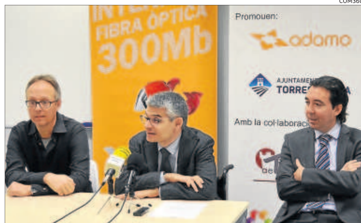
Ahir es va presentar l'acord a què han arribat el consistori i l'empresa

El PAES s'impulsa en el marc del Pacte d'Alcaldes i alcaldesses de la Unió Europea (UE), una iniciativa de lluita contra l'escalfament global.