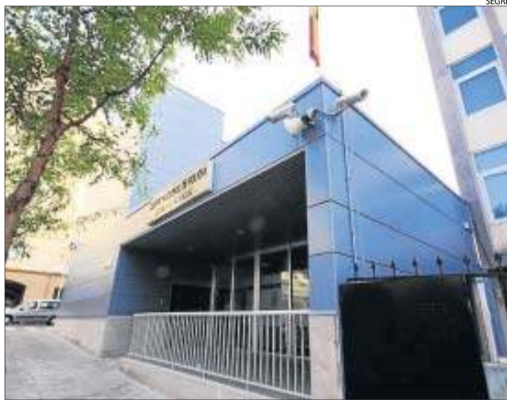
Imatge d'arxiu de la comissaria de la Policia Nacional.

Els agents han detingut 53 persones i n'han imputat unes altres 44, majoritàriament pakistaneses, a les províncies de Barcelona, Lleida, València i Getafe. El frau ocasionat a la Seguretat Social, per impagament de