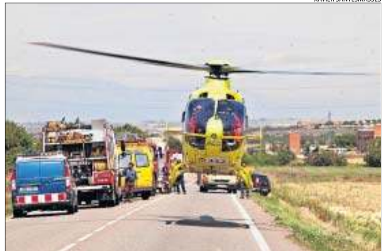
El ferit va ser traslladat en helicòpter dissabte a Tàrrega.

Dos persones van resultar ahir ferides de consideració en sengles accidents a Arbeca i a la Fuliola. El primer sinistre va passar a les 11.15 hores quan dos cotxes van xocar a Arbeca a la carretera C-233. L'ocupant d'un dels vehicles va resultar ferit i va ser traslladat a l'hospital Arnau de Vilanova.