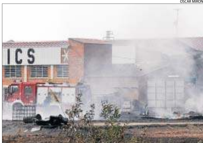
Els bombers van continuar ahir remullant la zona.