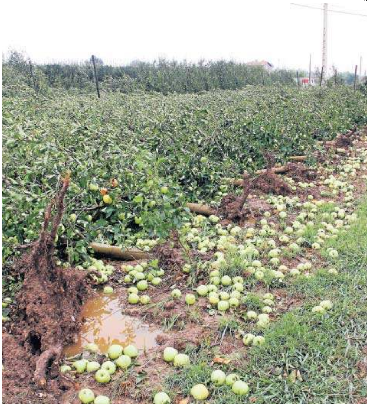
El vent va arrancar bona part de les pomeres d'aquesta finca al costat de la carretera de Corbins.