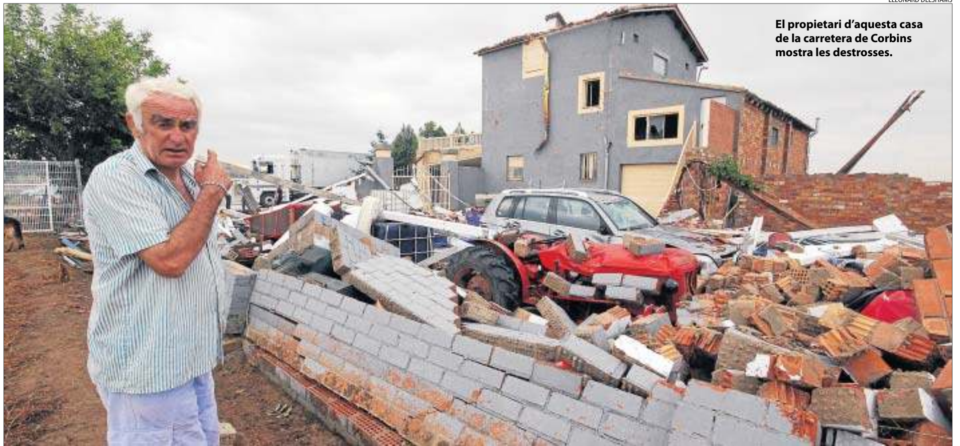
El propietari d'aquesta casa de la carretera de Corbins mostra les destrosses.