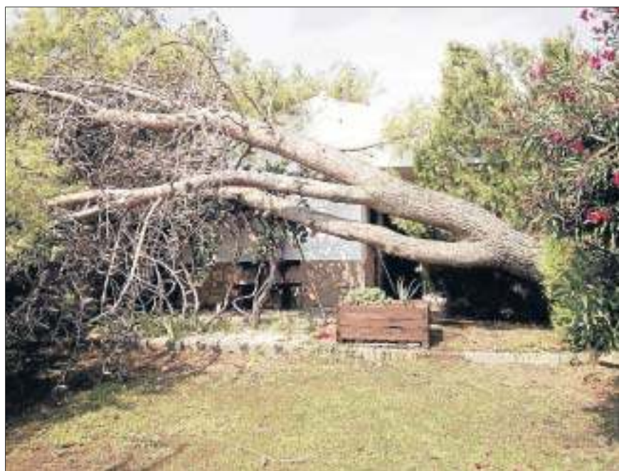
Aquesta casa de Torrefarrera es va lliurar per poc de l'impacte d'un gran arbre.