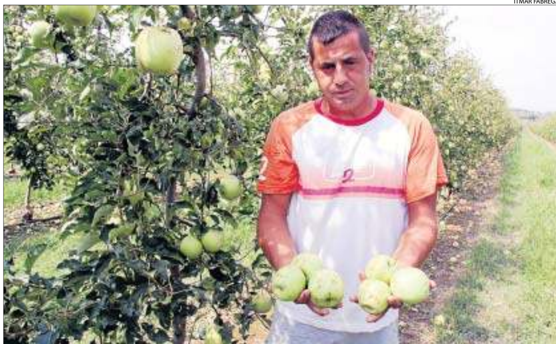
Un agricultor de Juneda mostra pomes picades per la pedra.

El telèfon d'emergències 112 va rebre un total de 159 trucades, la gran majoria des del Se-