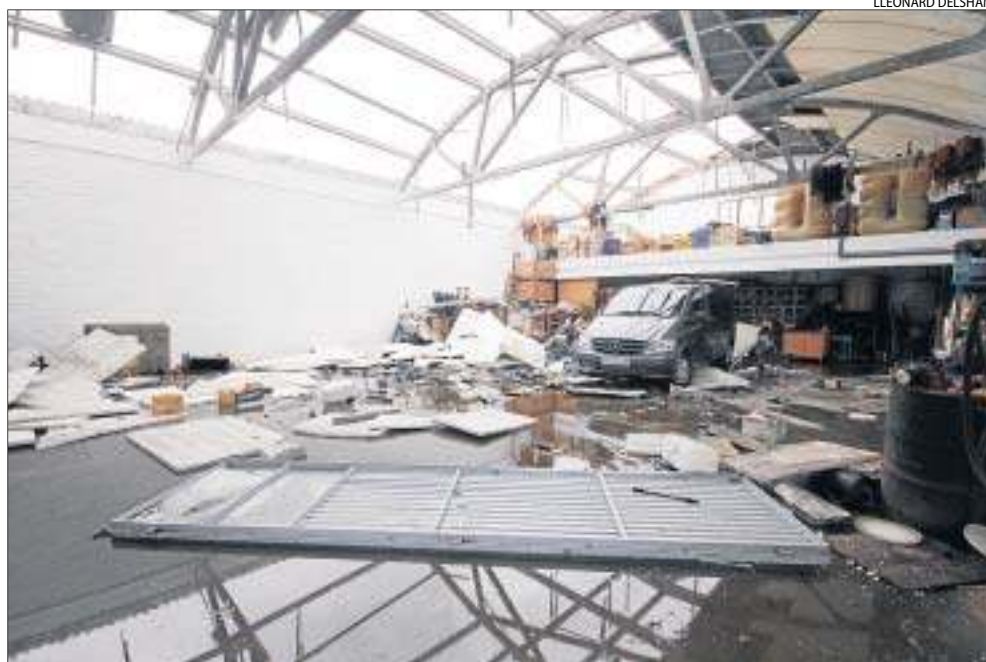
Aquest magatzem vora la carretera de Corbins també va quedar del tot destrossat.