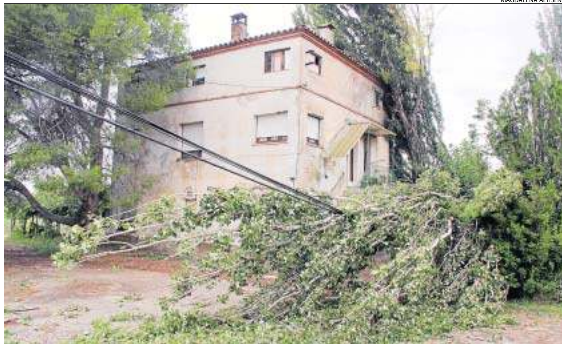
La caiguda d'arbres també va afectar línies elèctriques, com aquesta a Llívia.