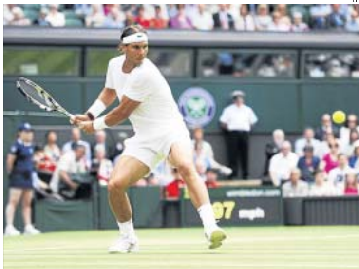
Rafa Nadal, durant el partit d'ahir davant el txec Rosol.

al txec, 52 de l'ATP, i va segellar el seu pas el tercer partit a Londres per primera vegada des del 2011, després d'haver caigut l'any passat contra el belga Steve Darcis, al primer duel del torneig, i el 2012 contra Rosol. Al balear, que aspira a conquerir el tercer Wimbledon, l'espera el kazakh Mikhaïl Kukuixkin, número 63 del món, un dretà a qui mai s'ha enfrontat sobre herba.