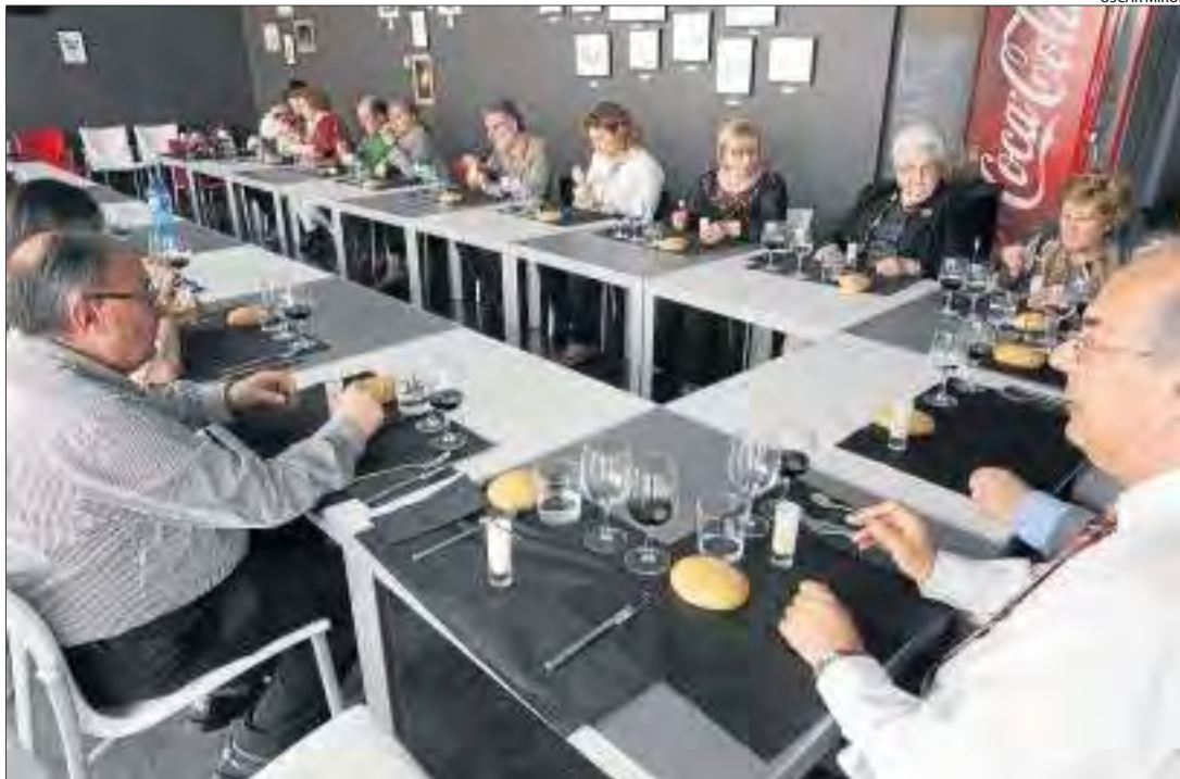
Un moment del dinar d'ahir al Museu de Lleida, amb més d'una vintena de persones.