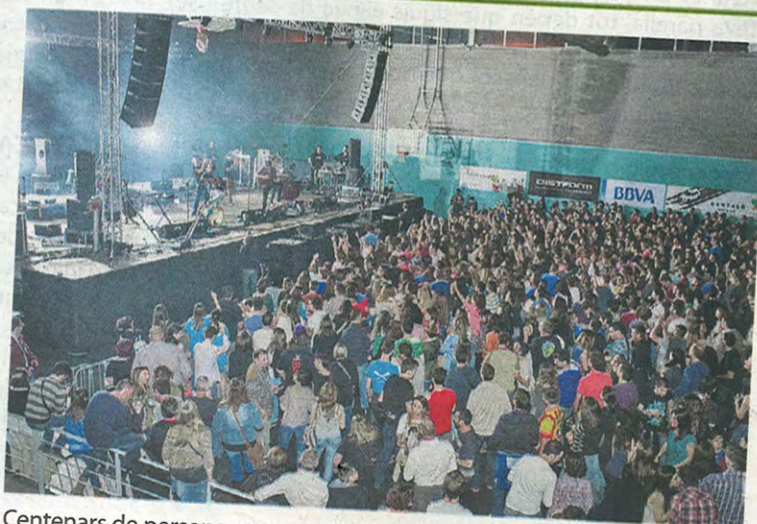
Centenars de persones van omplir el pavelló de Torrefarrera ■ Com360

superat les 1.200 persones de l'any passat". Casanovas confirma que "l'any que ve hi haurà quarta edició i el nostre objectiu serà consolidar el Re-Sona Kids un cop vista la bona acceptació que ha rebut enguany". Amb el Re-Sona Kids, per primera vegada, els organitzadors van apostar per una proposta d'oci familiar que va complementar l'oferta del festival per apropar la música als més petits. Més de 400 persones van gaudir dels combos i tallers, així com un berenar per a petits i grans.