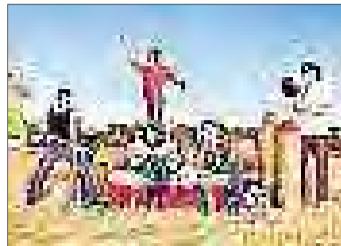
El grup Naraina.