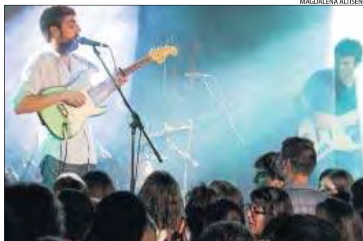
Concert de Manel dissabte a la nit a Cotton Club de Lleida.

Concert de Manel a la capital del Segrià i festival Re-Sona