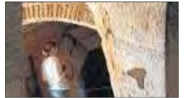
Pous del Gel de Lleida.