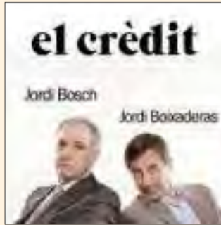
EL CRÈDIT Dissabte 21 de juny. 21.00 h.

Més informació a www.teatredelalotja.cat o trucant al 973 248 925 / 973 239 698. Venda d'entrades a www.teatredelalotja.cat , la taquilla del teatre de dilluns a dissabte (17.00 a 21.00 h) i Oficina de Turisme de Lleida (c. Major 31 bis).