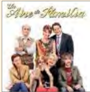
UN AIRE DE FAMÍLIA Dissabte 17 de maig. 21.00 h.