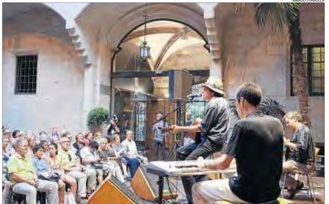
Baró va presentar 'La ruta dels genets' l'estiu passat al pati gòtic de l'IEI.