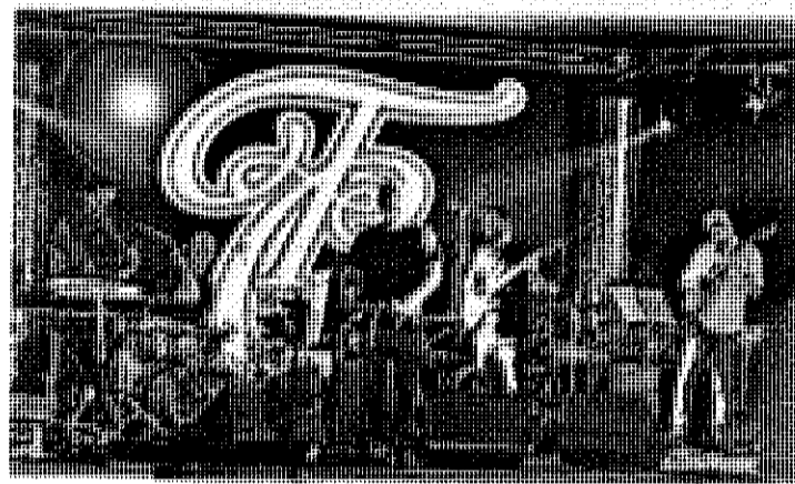
The Crossfathers en concert

El grup de folk, pop, indie i jazz fusió Els Catarres serà l'altre cap de cartell del Re-Sona. El grup va acaparar els Premis Enderrock 2014 guanyant per votació popular cinc premis. Els acompanyaran Buhos, Germà Negre i Miquel del Roig.