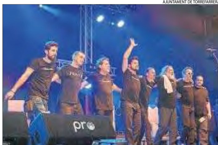
Els Pets van actuar en el festival Re-Sona de Torrefarrera.