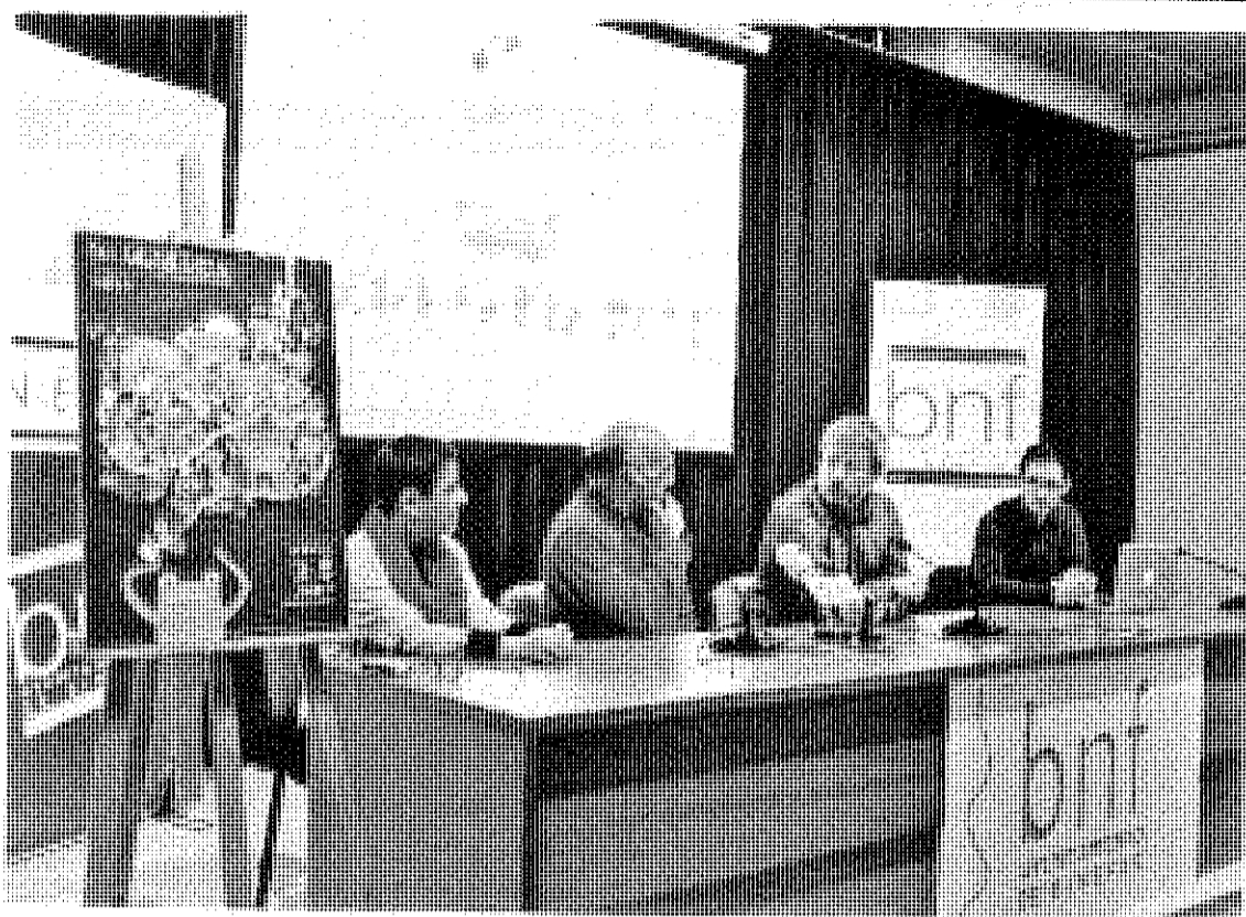
Presentació del festival a l'Ajuntament de Binéfar ■ Imaginaria