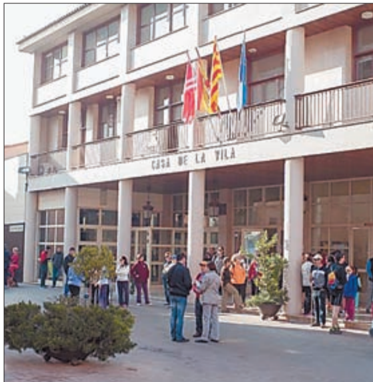
L'Ajuntament fa balanç del darrer any

A més, per primer cop en els últims anys, l'Ajuntament no té pòlisses pendents. Segons fonts