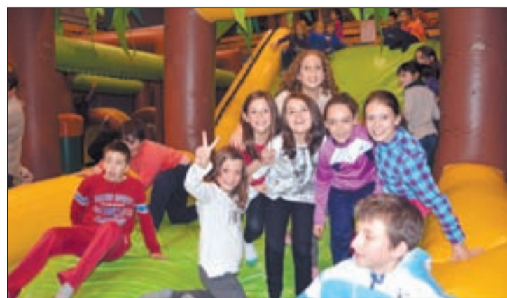
Els més petits van gaudir del parc