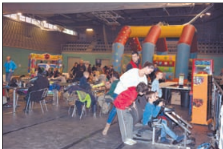
Sis dies de diversió i jocs per als més petits

El passat diumenge, 4 de gener, després de sis dies d'intensa activitat de jocs i diversió per als més petits i joves del municipi, va tancar el Parc de Nadal de Torrefarrera amb unes xifres de rècord, amb prop de 450 visites diàries, més de 200 visites més que en l'edició de l'any passat.